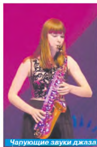
Чарующие звуки джаза