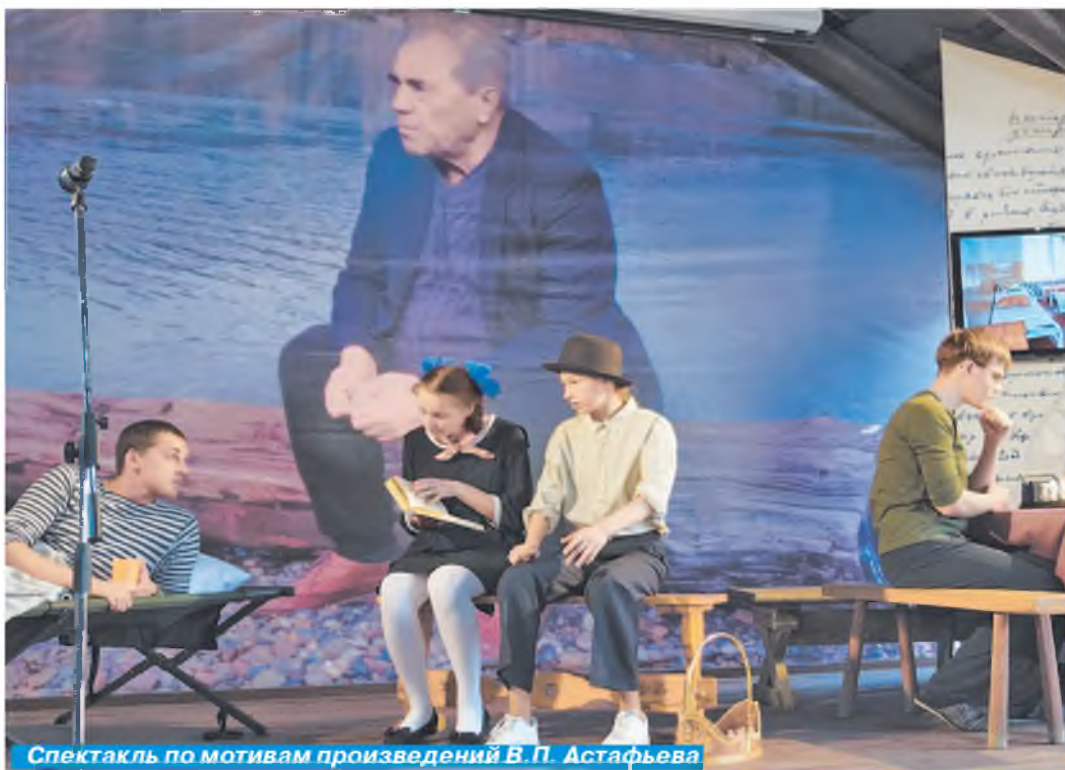
Спектакль по мотивам произведений В. П. Астафьева

Более 300 человек приняли участие в десятом, юбилейном Межрегиональном фестивале «Астафьевская весна», который состоялся 20 мая в Овсянке. На родину писателя съехались представители учебных заведений из Красноярского края и Кемеровской области. Впервые в этом году фестиваль проводился под патронатом Губернатора Красноярского края В. А. Толоконского.