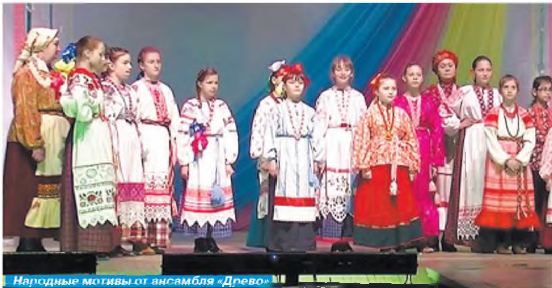
Народные мотивы от ансамбля «Древо»

Отчетный концерт Детской школы искусств «Живая музыка кино» состоялся 30 апреля на сцене Городского Дворца культуры «Энергетик». Свое выступление участники концерта посвятили Году кино в России.