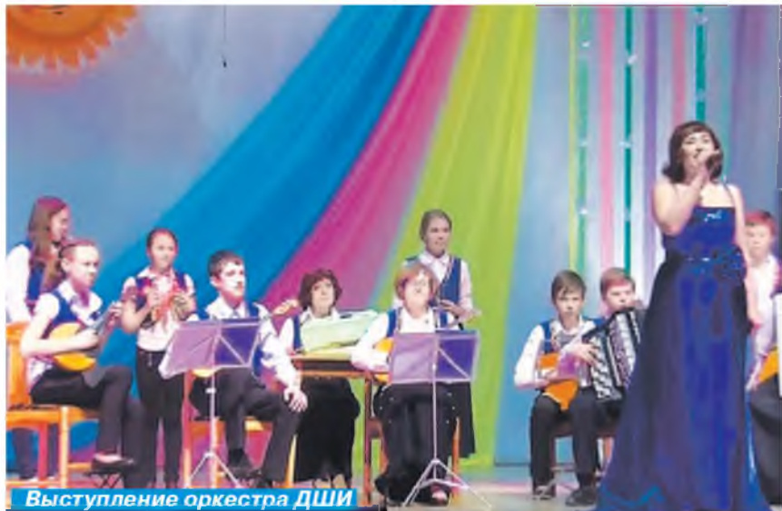
Выступление оркестра ДШИ