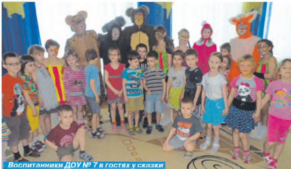
Воспитанники ДОУ № 7 в гостях у сказки

и Н.Н. Довгий. Ребята учили слова, репетировали танцы, девочки старших классов помогали шить костюмы