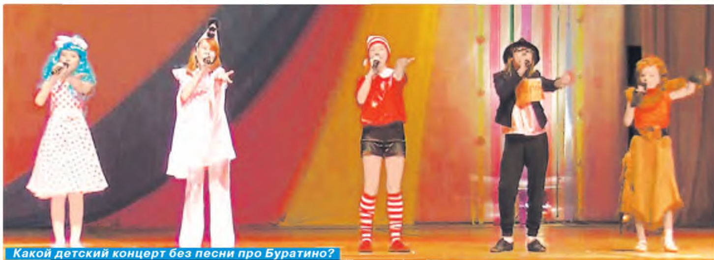
Какой детский концерт без песни про Буратино?

Заключительной точкой этого праздника стало исполнение знаменитой, нестареющей песни «Веселый ветер»