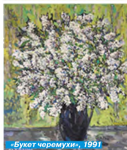
«Букет черемухи», 1991